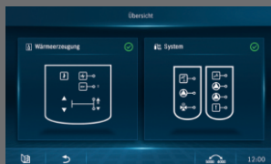
Меню как в Logamatic 4000