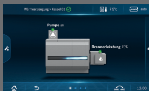
Ручной режим/ мониторинг котла