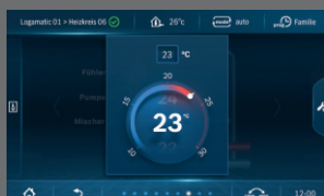
Установка комнатной температуры