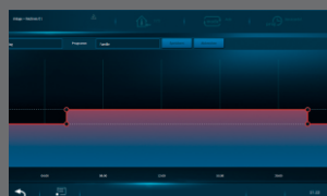
Управление контуром отопления