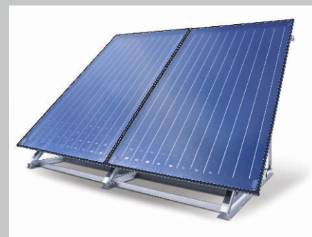
Logasol SKN 4.0