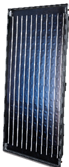
Logasol SKN 4.0

Система Buderus может покрыть большую часть ваших потребностей в горячем водоснабжении благодаря большому количеству солнечных часов в Центральной Азии.