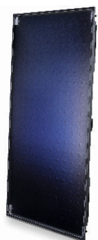
Logasol SKT 1.0

Коллекторы Logasol SKN 4.0 долговечны и идеально подходят для нагрева воды. Эффективность солнечного коллектора определяется его покрытием. Медный абсорбер с частично-селективным покрытием поглощает тепловую энергию солнца с эффективностью до 77%. Ударопрочное безосколочное стекло пропускает 85% света. Все это гарантирует максимально эффективное использование энергии.