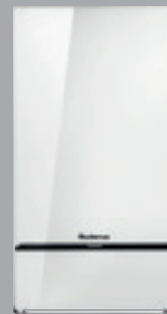
Logamax plus GB172i bianca