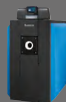
Logano plus SB625