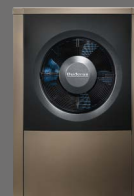
Logatherm WLW196i AR