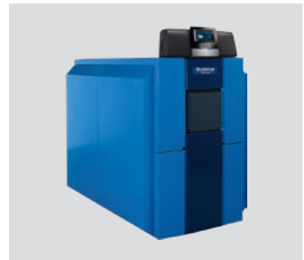
Logano plus SB625 – Esercizio silenzioso.