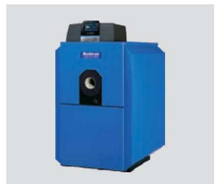
Logano plus SB325 – Sfruttamento energetico ottimizzato negli impianti con differenti requisiti di temperatura.