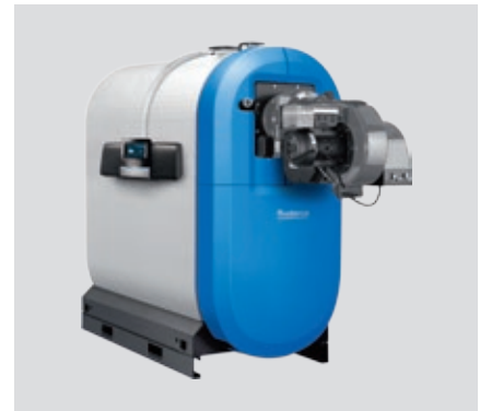
Logano plus SB745 – Compatto, leggero e facile da mantenere.